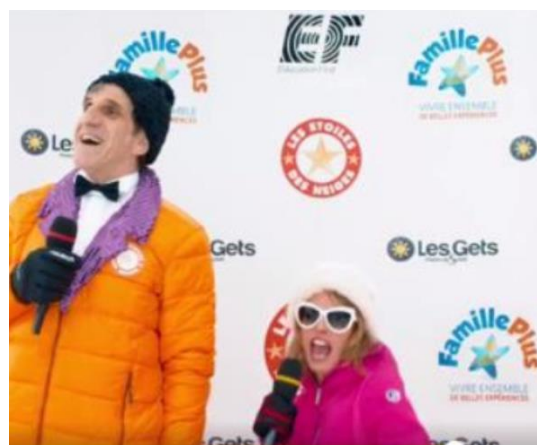
Famille Plus à l'affiche